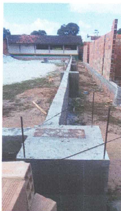
Imagem 05: Construção de quadra poliesportiva.