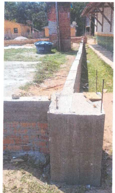
Imagem 03: Construção de quadra poliesportiva.