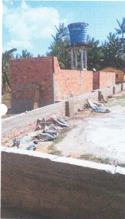
Imagem 01: Construção de quadra poliesportiva.

OBJETO: CONSTRUÇÃO DE 01 (UMA) QUADRA POLIESPORTIVA COM VESTIÁRIO E ARQUIBANCADAS COBERTAS, COM ÁREA CONSTRUÍDA DE 885 m 2 – NA LOCALIDADE DO CENTRO ALEGRE, NO MUNICÍPIO DE VISEU-PA.