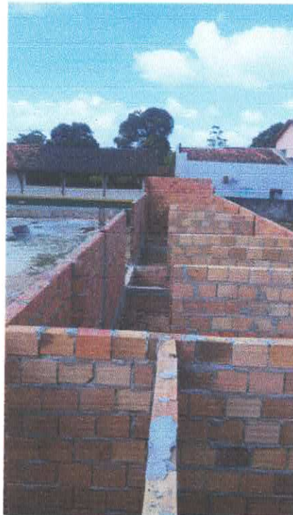
Imagem 02: Construção de quadra poliesportiva.