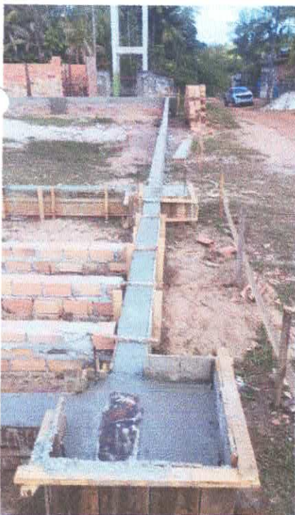
Imagem 04: Construção de quadra poliesportiva.