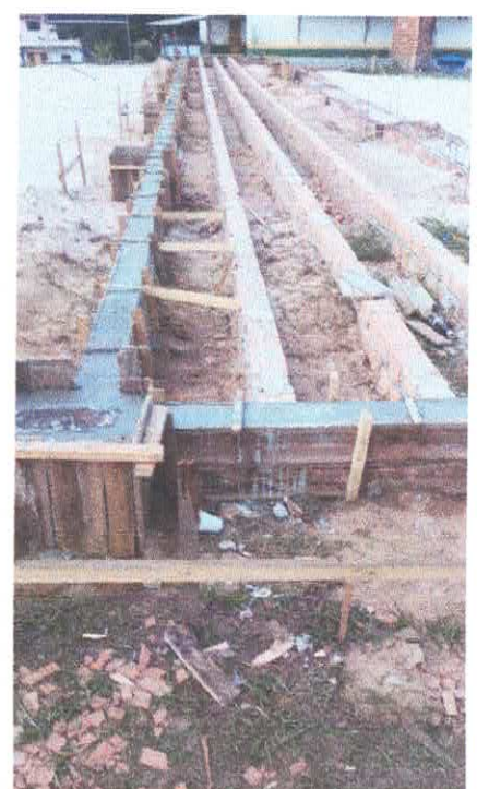
Imagem 06: Construção de quadra poliesportiva.