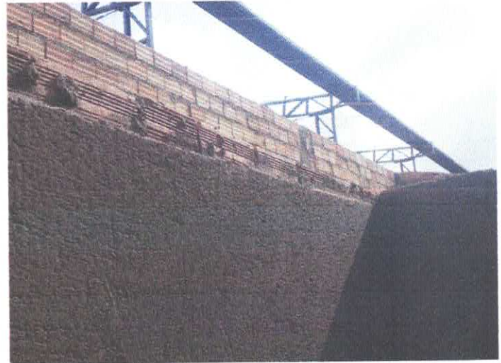
Imagem 04: Construção de quadra poliesportiva.