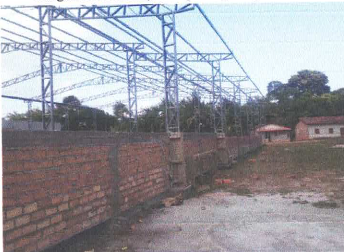
Imagem 11: Construção de quadra poliesportiva.