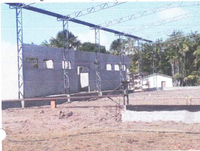
Imagem 09: Construção de quadra poliesportiva.