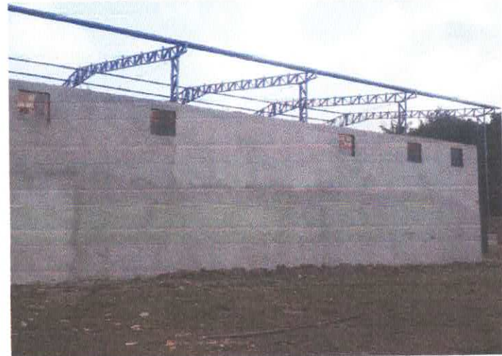
Imagem 12: Construção de quadra poliesportiva.