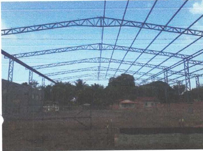
Imagem 01: Construção de quadra poliesportiva.

OBJETO: CONSTRUÇÃO DE 01 (UMA) QUADRA POLIESPORTIVA COM VESTIÁRIO E ARQUIBANCADAS COBERTAS, COM ÁREA CONSTRUÍDA DE 885 m 2 – NA LOCALIDADE DO BOMBOM, NO MUNICÍPIO DE VISEU-PA.