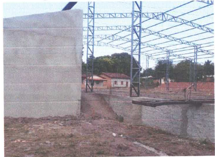
Imagem 10: Construção de quadra poliesportiva.