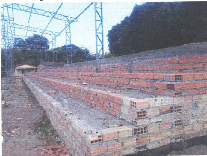
Imagem 03: Construção de quadra poliesportiva.