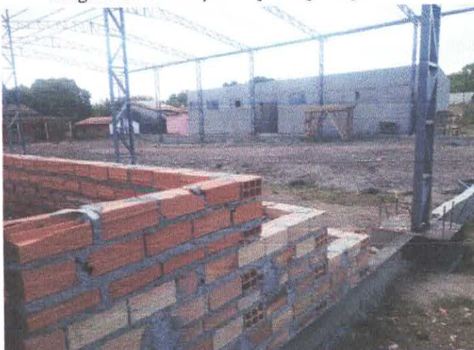
Imagem 05: Construção de quadra poliesportiva.