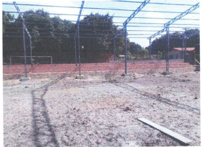
Imagem 02: Construção de quadra poliesportiva.