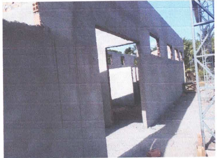
Imagem 08: Construção de quadra poliesportiva.