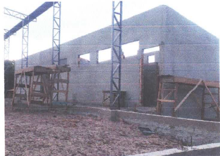
Imagem 06: Construção de quadra poliesportiva.