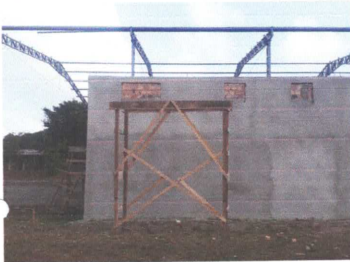
Imagem 07: Construção de quadra poliesportiva.

OBJETO: CONSTRUÇÃO DE 01 (UMA) QUADRA POLIESPORTIVA COM VESTIÁRIO E ARQUIBANCADAS COBERTAS, COM ÁREA CONSTRUÍDA DE 885 m 2 – NA LOCALIDADE DO BOMBOM, NO MUNICÍPIO DE VISEU-PA.