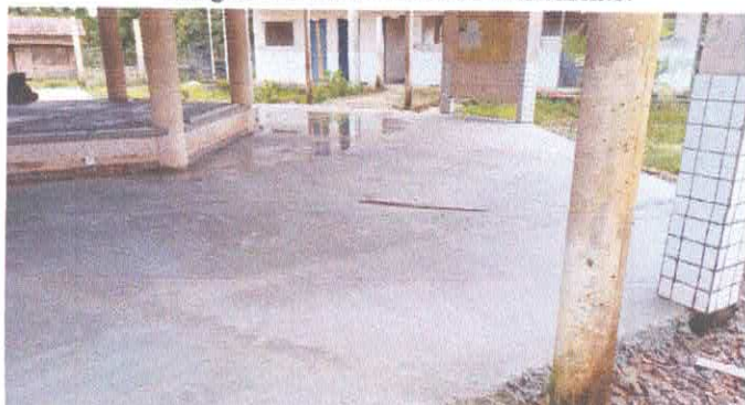
Imagem 08: Escola Diomar Nascimento.