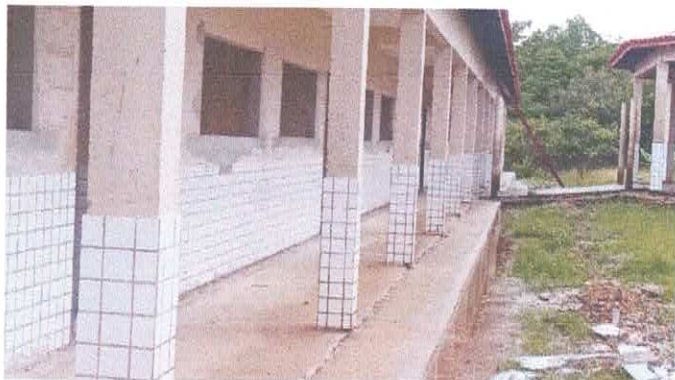
Imagem 01: Escola Diomar Nascimento.

Objeto: REFORMA E AMPLIAÇÃO DA E.M.E.F. DIOMAR LIMA DO NASCIMENTO ALVES (POLO VILA CARDOSO) COM 867,79 m 2 – NO MUNICÍPIO DE VISEU-PA..