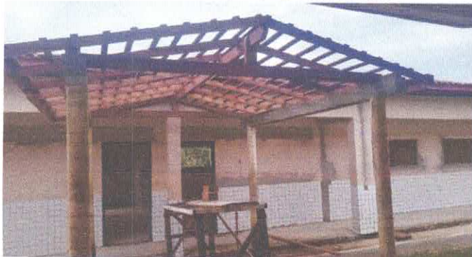
Imagem 07: Escola Diomar Nascimento.