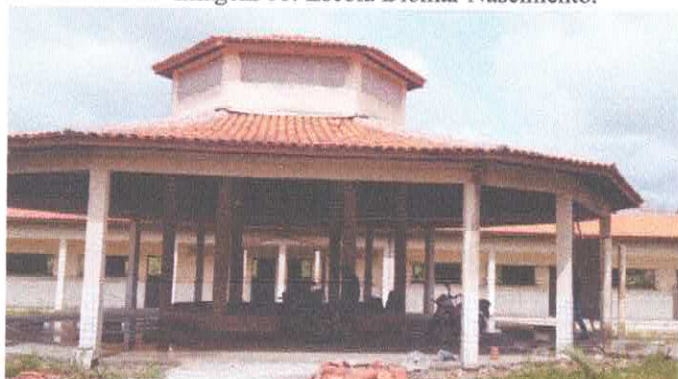
Imagem 03: Escola Diomar Nascimento.