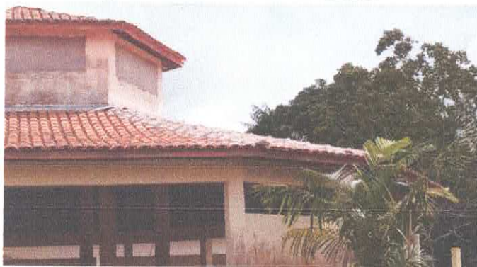
Imagem 05: Escola Diomar Nascimento.