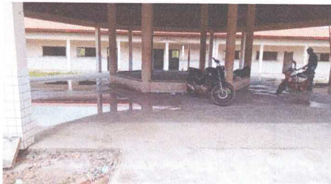
Imagem 02: Escola Diomar Nascimento.