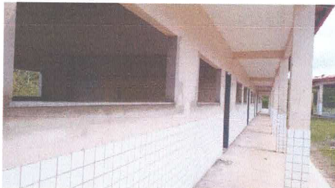
Imagem 06: Escola Diomar Nascimento.