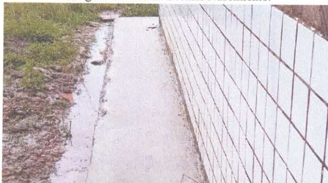
Imagem 04: Escola Diomar Nascimento.