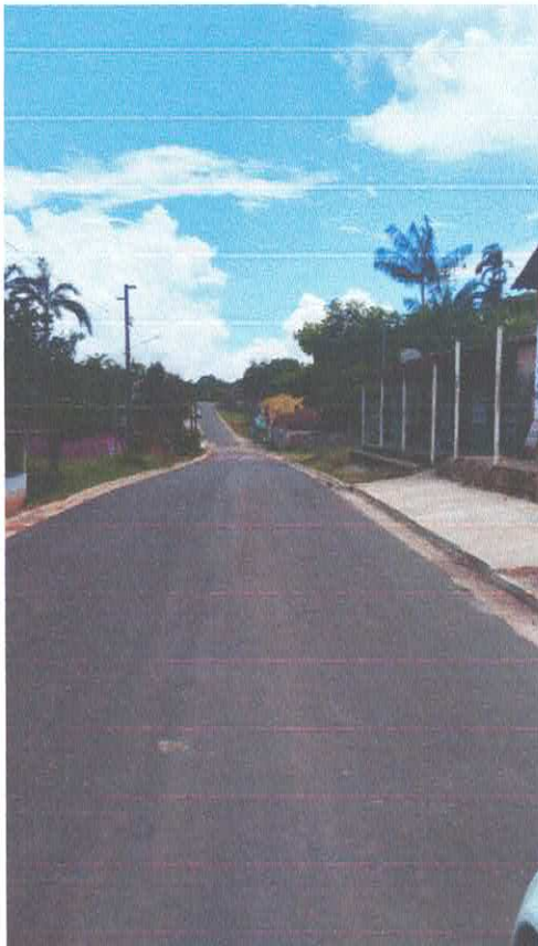
Imagem 02: Pavimentação.