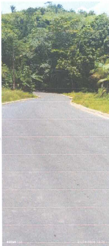
Imagem 01: Pavimentação.

CONTRATO: Nº624/2022/CPL CONVÊNIO: Nº 286/2022 CONCORRÊNCIA PÚBLICA: Nº 02/2022. OBJETO: CONTRATAÇÃO DE EMPRESA ESPECIALIZADA PARA O SERVIÇO DE PAVIMENTAÇÃO ASFÁLTICA DE 3,3 KM NAS COMUNIDADES DE CENTRO ALEGRE E JUTAÍ, NO MUNICÍPIO DE VISEU/PA