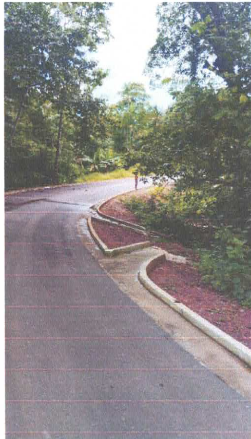
Imagem 03: Pavimentação