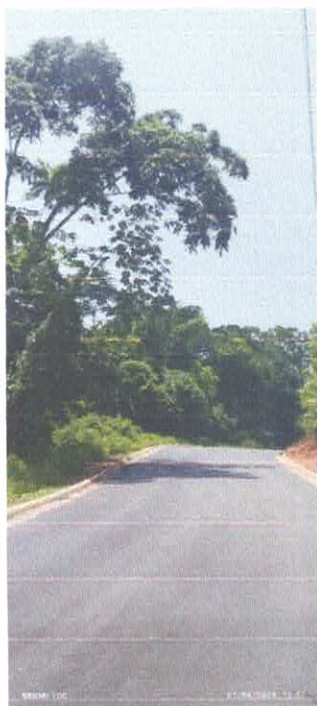
Imagens 04: Pavimentação.