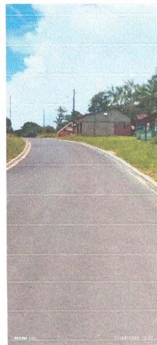
Imagens 07: Pavimentação.