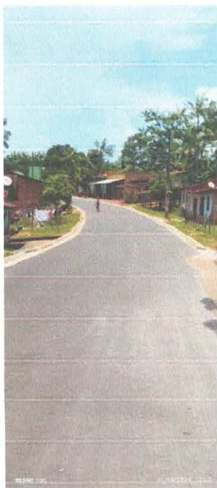
Imagens 05: Pavimentação.