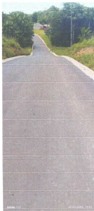
Imagens 06: Pavimentação.