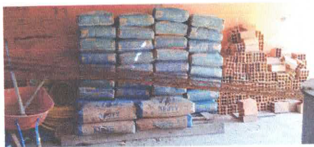
Imagem 03: Construção da UBS em Carrapatinho