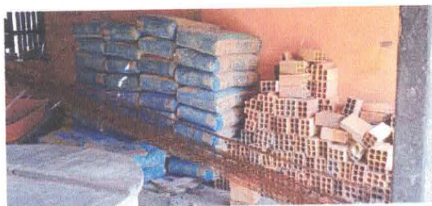
Imagem 02: Construção da UBS em Carrapatinho