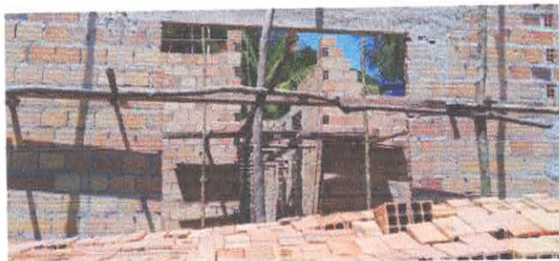
Imagem 01: Construção da UBS em Carrapatinho.

OBJETO: : LOTE 01: CONSTRUÇÃO DE 01 (UMA) UNIDADE BÁSICA DE SAÚDE (UBS), COM ÁREA CONSTRUÍDA DE 90,37 M 2 , NA LOCALIDADE DE CARRAPATINHO, NO MUNICÍPIO DE VISEU/PA.