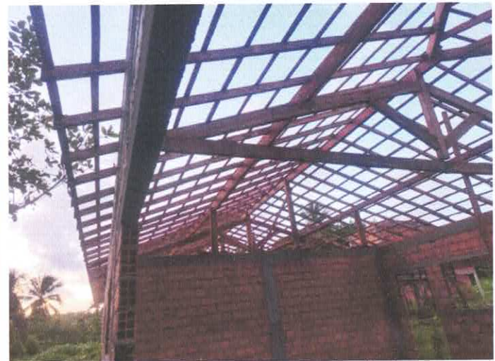
Imagem 04: Vista da estrutura do telhado.

CARLOS AUGUSTO PINTO CORREA:00 433788208