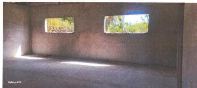
Imagem 02: Construção da E.M.E.F. Ângela Reis