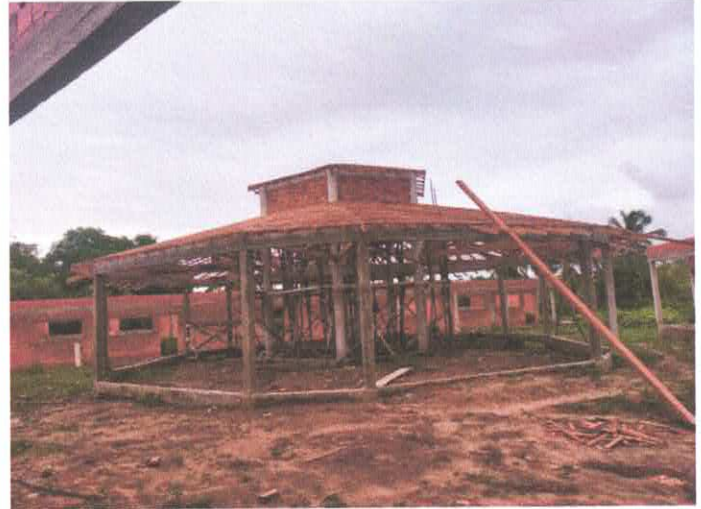
Imagem 02: Vista central da obra.