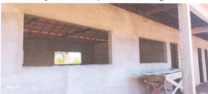
Imagem 03: Construção da E.M.E.F. Ângela Reis