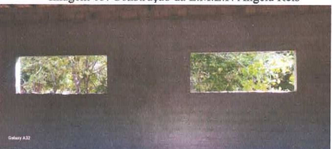
Imagem 07: Construção da E.M.E.F. Ângela Reis