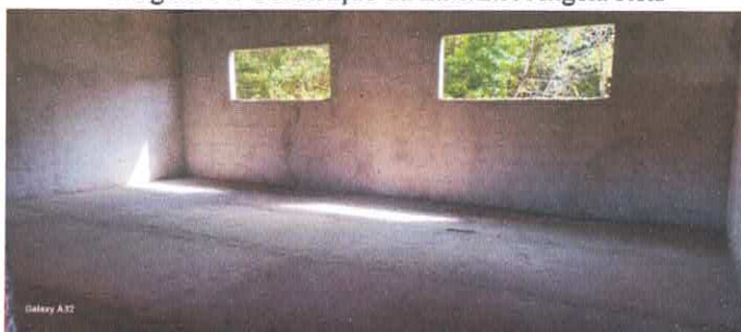
Imagem 06: Construção da E.M.E.F. Ângela Reis