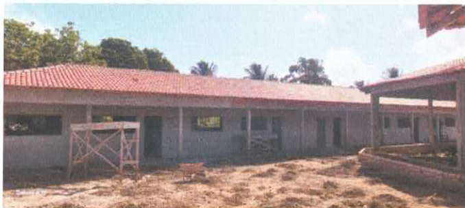
Imagem 01: Construção da E.M.E.F. Ângela Reis

OBJETO: CONTRATAÇÃO DE EMPRESA ESPECIALIZADA PARA FINALIZAÇÃO DA CONSTRUÇÃO DA E.M.E.F. PROFESSORA ANGELA OLIVEIRA REIS, POLO DE LIMONDEUA - LOCALIDADE DE TAPEREbateua, NO MUNICÍPIO DE VISEU/PA.