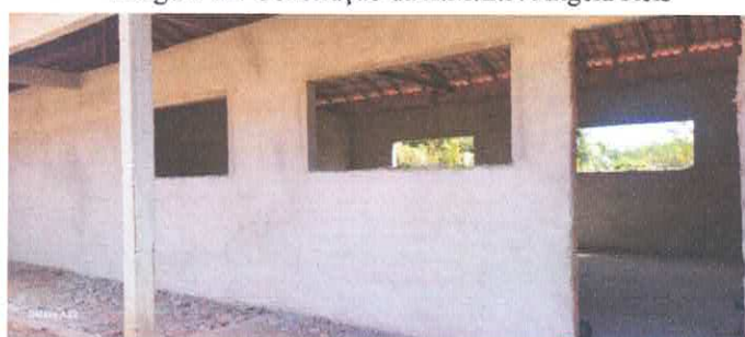
Imagem 04: Construção da E.M.E.F. Ângela Reis