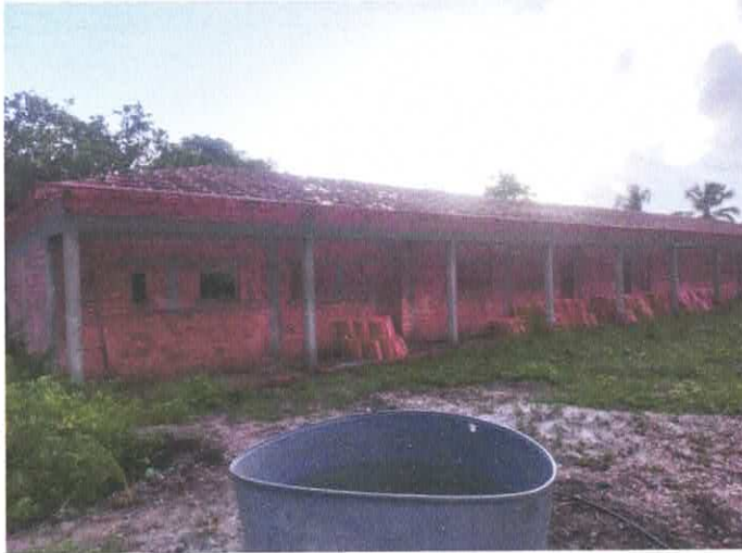
Imagem 01: Vista do bloco de salas.

OBJETO: : CONTRATAÇÃO DE EMPRESA ESPECIALIZADA PARA FINALIZAÇÃO DA CONSTRUÇÃO DA E.M.E.F. PROFESSORA ANGELINA OLIVEIRA REIS - POLO DE LIMONDEUA- LOCALIDADE DE TAPEREBATEUA, NO MUNICÍPIO DE VISEU/PA.