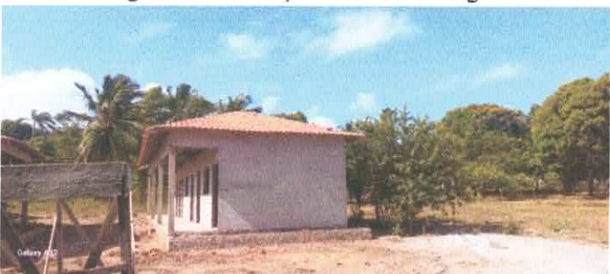
Imagem 05: Construção da E.M.E.F. Ângela Reis