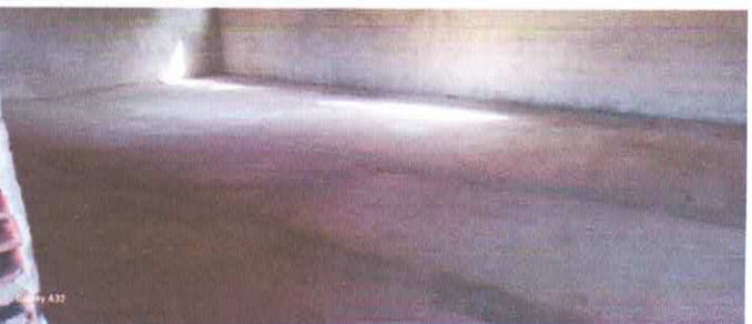
Imagem 09: Construção da E.M.E.F. Ângela Reis