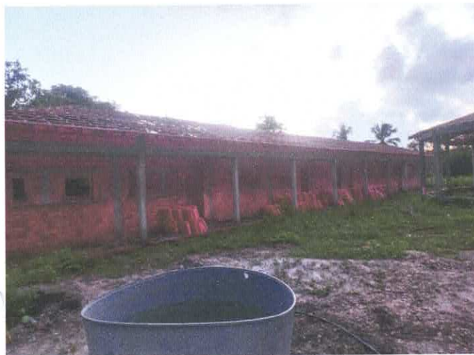
Imagem 03: Vista do bloco de salas.