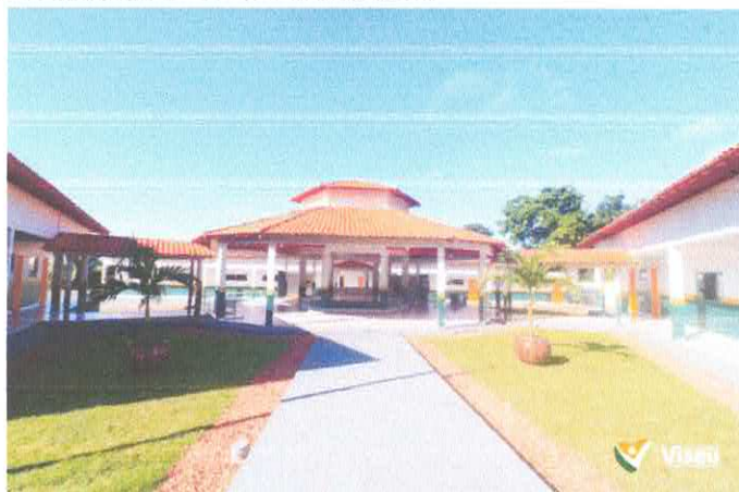
Imagem 01: Construção da Escola Gregório Coelho.

OBJETO: CONTRATAÇÃO DE EMPRESA ESPECIALIZADA PARA FINALIZAÇÃO DA CONSTRUÇÃO DA E.M.E.F. GREGÓRIO DA SILVA COELHO - POLO LAGUINHO - LOCALIDADE DE ITAÇU, PADRÃO FNDE, NO MUNICÍPIO DE VISEU/PA.