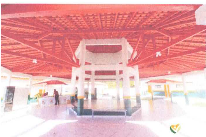
Imagem 05: Construção da Escola Gregório Coelho.