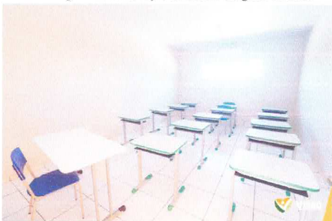
Imagem 03: Construção da Escola Gregório Coelho.