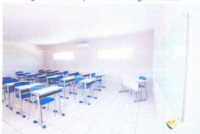
Imagem 04: Construção da Escola Gregório Coelho.