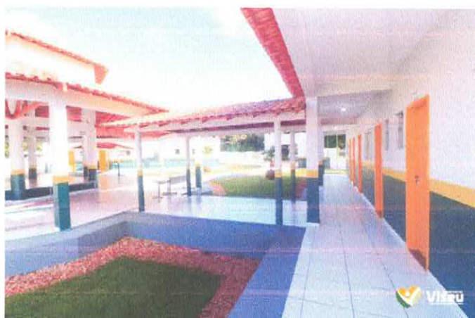
Imagem 02: Construção da Escola Gregório Coelho.