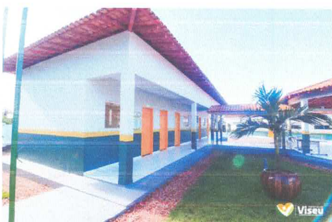
Imagem 06: Construção da Escola Gregório Coelho.

CARLOS AUGUSTO PINTO CORREA:004337 88208