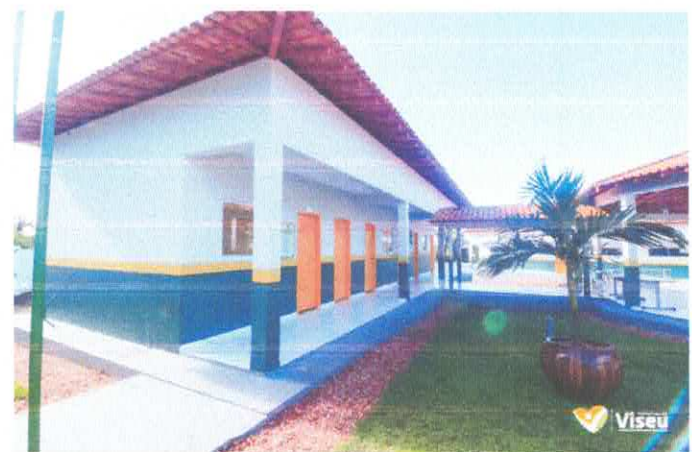
Imagem 06: Construção da Escola Gregório Coelho.

CARLOS AUGUSTO PINTO CORREA:00433 788208