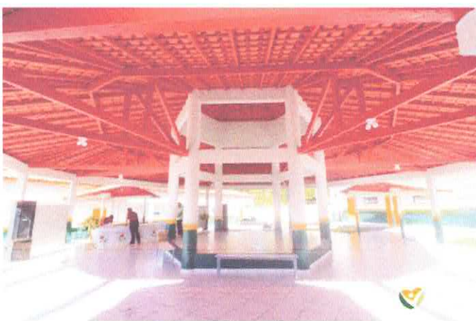
Imagem 05: Construção da Escola Gregório Coelho.