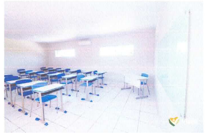
Imagem 04: Construção da Escola Gregório Coelho.