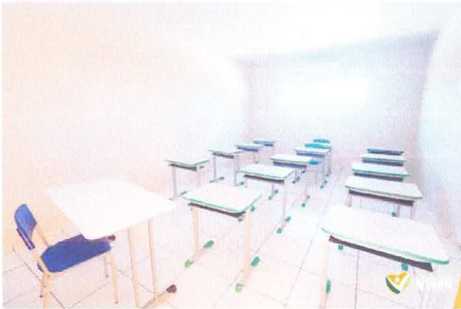
Imagem 03: Construção da Escola Gregório Coelho.