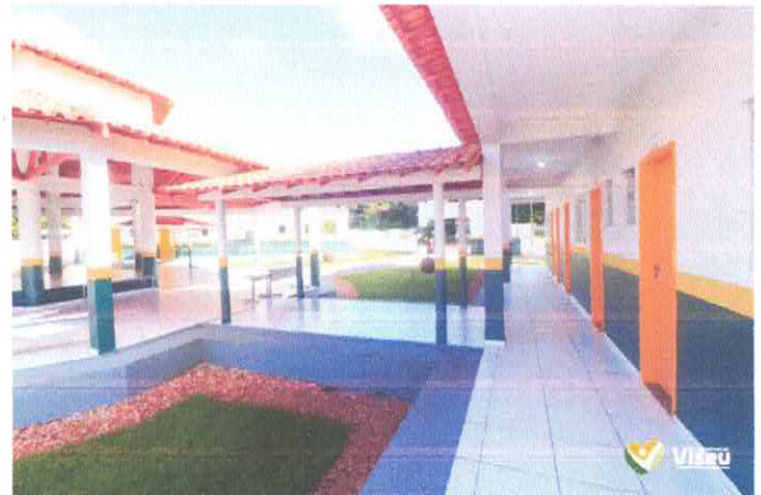
Imagem 02: Construção da Escola Gregório Coelho.