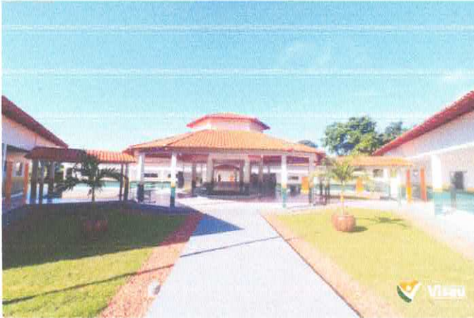
Imagem 01: Construção da Escola Gregório Coelho.

OBJETO: CONTRATAÇÃO DE EMPRESA ESPECIALIZADA PARA FINALIZAÇÃO DA CONSTRUÇÃO DA E.M.E.F. GREGÓRIO DA SILVA COELHO - POLO LAGUINHO - LOCALIDADE DE ITAÇU, PADRÃO FNDE, NO MUNICÍPIO DE VISEU/PA.