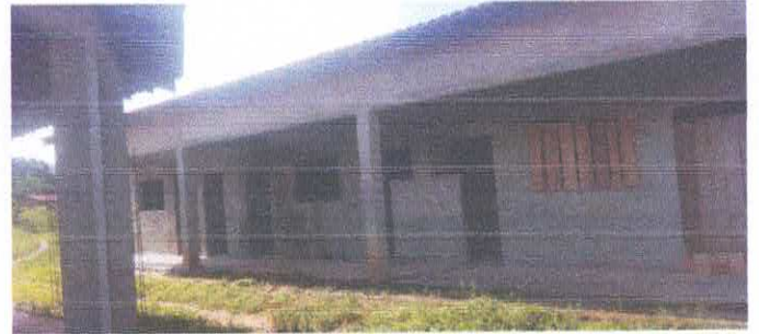
Imagem 02: Reforma da Escola Lucelina de Fátima.