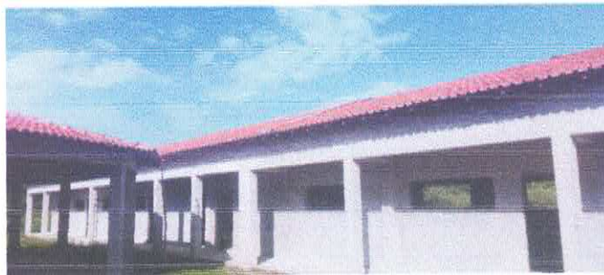
Imagem 05: Reforma da Escola Lucelina de Fátima..