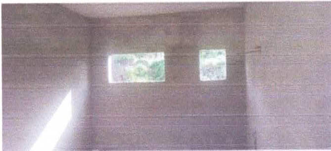
Imagem 03: Reforma da Escola Lucelina de Fátima.