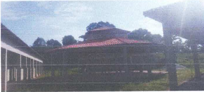
Imagem 01: Reforma da Escola Lucelina de Fátima.

OBJETO: CONTRATAÇÃO DE EMPRESA ESPECIALIZADA PARA A FINALIZAÇÃO DA CONSTRUÇÃO DA E.M.E.F. LUCELINA DE FÁTIMA SANTOS CARVALHO - POLO AÇAITEUA – LOCALIDADE DE CENTRO ALEGRE – PADRÃO FNDE, NO MUNICÍPIO DE VISEU-PA.