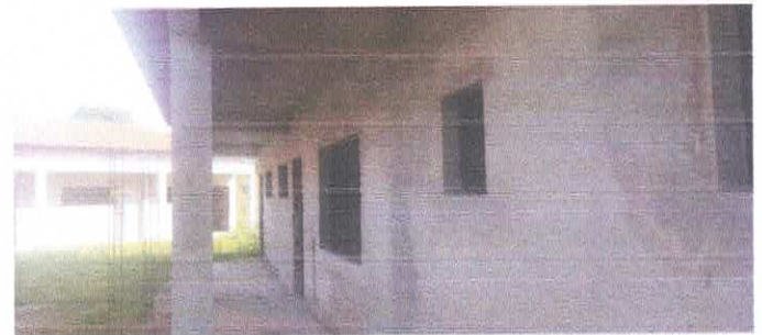
Imagem 04: Reforma da Escola Lucelina de Fátima.