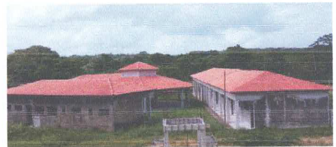
Imagem 06: Reforma da Escola Lucelina de Fátima.

CARLOS AUGUSTO PINTO CORREA:00 433788208