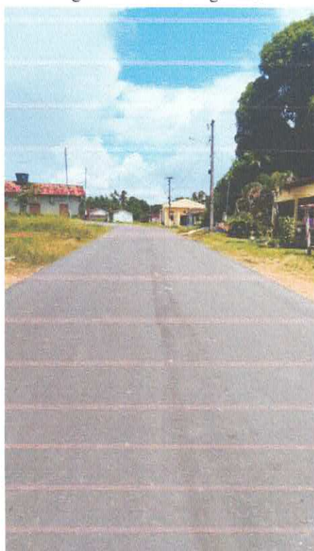
Imagem 05: Alfalto Laguinho.