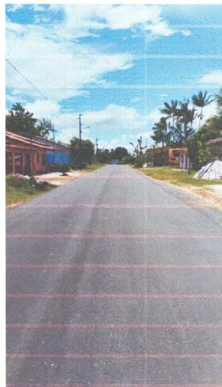
Imagem 03: Alfalto Laguinho.