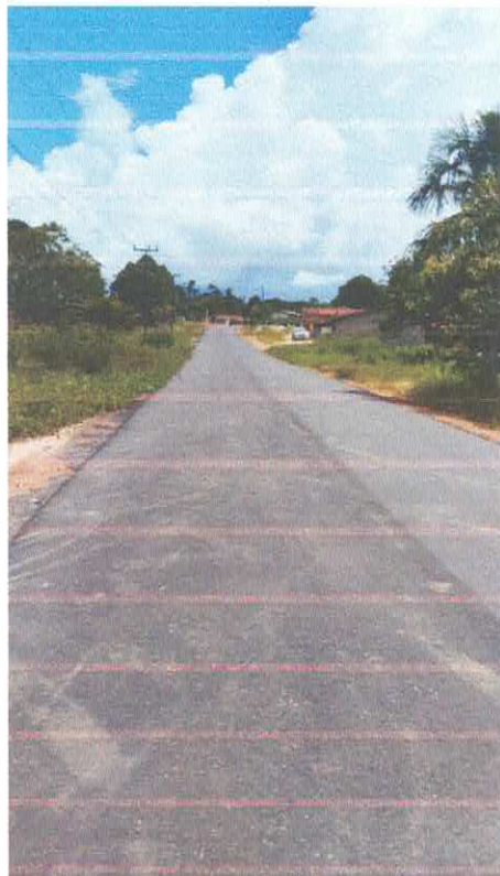
Imagem 13: Alfalto Laginho.

CONTRATO: Nº 613/2022/CPL TOMADA DE PREÇO: Nº 029/2022. CONVÊNIO: SEDOP Nº 285/2022 OBJETO: CONTRATAÇÃO DE EMPRESA ESPECIALIZADA PARA O SERVIÇO DE PAVIMENTAÇÃO ASFÁLTICA DE 1,9 KM NA COMUNIDADE DE LAGUINHO, NO MUNICÍPIO DE VISEU/PA.