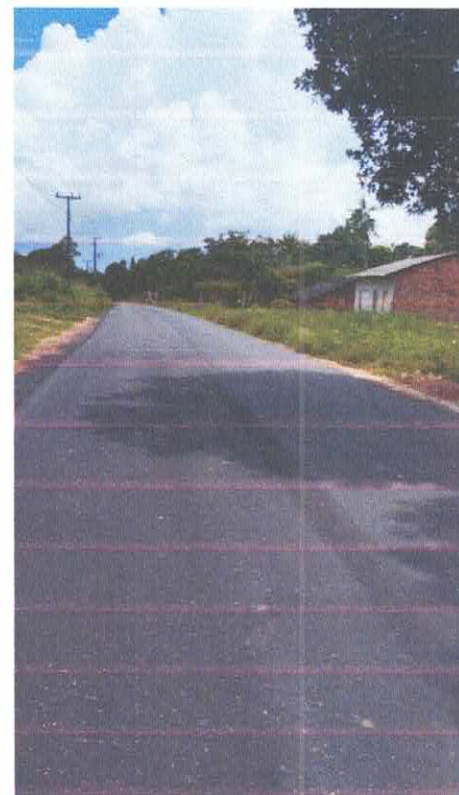
Imagem 15: Alfalto Laginho.