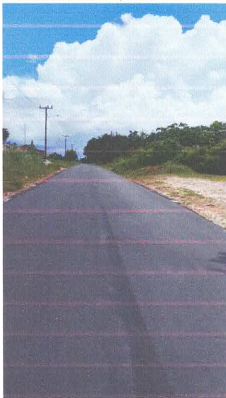
Imagem 07: Alfalto Laguinho.

CONTRATO: Nº 613/2022/CPL TOMADA DE PREÇO: Nº 029/2022. CONVÊNIO: SEDOP Nº 285/2022 OBJETO: CONTRATAÇÃO DE EMPRESA ESPECIALIZADA PARA O SERVIÇO DE PAVIMENTAÇÃO ASFÁLTICA DE 1,9 KM NA COMUNIDADE DE LAGUINHO, NO MUNICÍPIO DE VISEU/PA.