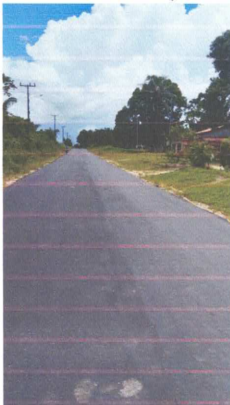
Imagem 08: Alfalto Laguinho.