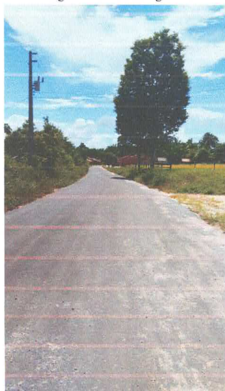
Imagem 04: Alfalto Laguinho.