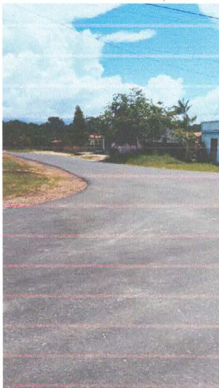
Imagem 02: Alfalto Laguinho.