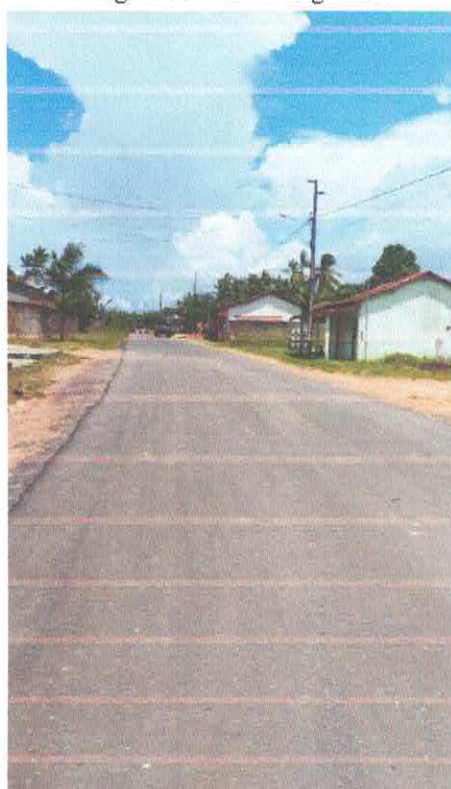
Imagem 11: Alfalto Laguinho.