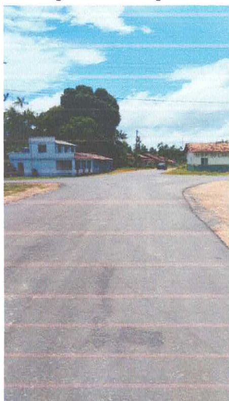
Imagem 10: Alfalto Laguinho.