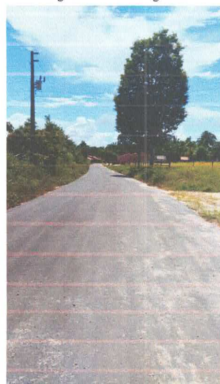
Imagem 12: Alfalto Laguinho.

CARLOS AUGUSTO PINTO CORREA:004337882 08