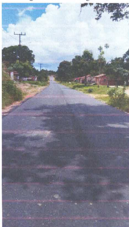
Imagem 17: Alfalto Laginho.

CARLOS AUGUSTO PINTO CORREA:00433 788208