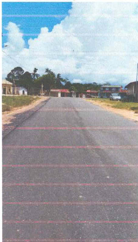
Imagem 01: Alfalto Laguinho.

CONTRATO: Nº 613/2022/CPL TOMADA DE PREÇO: Nº 029/2022. CONVÊNIO: SEDOP Nº 285/2022 OBJETO: CONTRATAÇÃO DE EMPRESA ESPECIALIZADA PARA O SERVIÇO DE PAVIMENTAÇÃO ASFÁLTICA DE 1,9 KM NA COMUNIDADE DE LAGUINHO, NO MUNICÍPIO DE VISEU/PA.