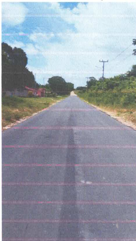
Imagem 14: Alfalto Laginho.