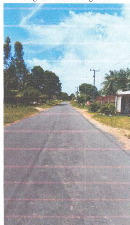
Imagem 06: Alfalto Laguinho.