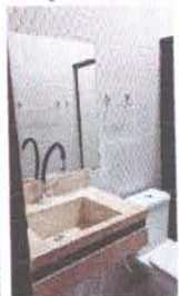
Imagem 04: WC