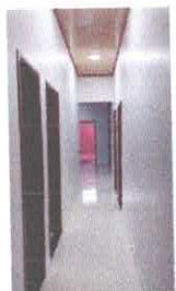
Imagem 03: Circulação