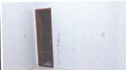
Imagem 13: Porta em madeira