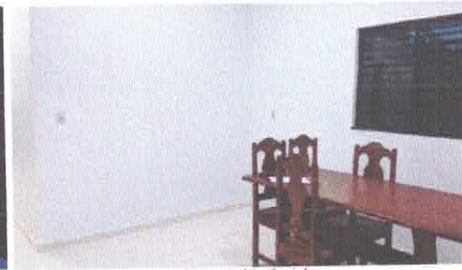
Imagem 10: Cozinha