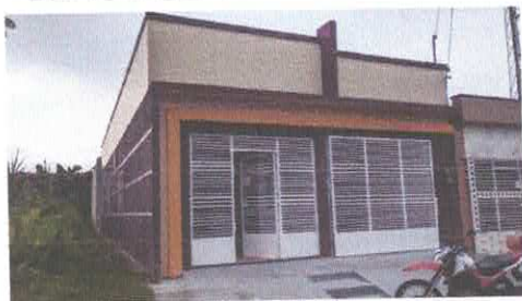
Imagem 01: Fachada