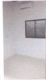
Imagem 05: Quarto