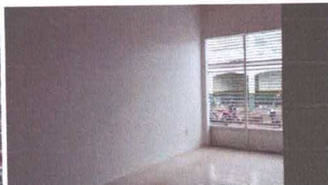
Imagem 02: Garagem