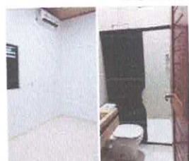
Imagem 11: Revest.