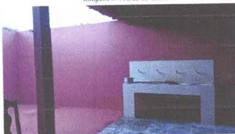
Imagem 09: Lavatório