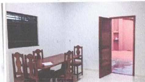
Imagem 08: Cozinha