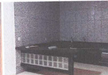
Imagem 06: Copa-Cozinha