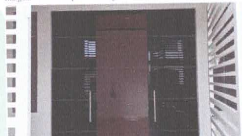
Imagem 07: Área de entrada