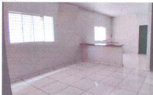
Imagem 10: Balcão