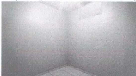
Imagem 12: Parede com revestimento