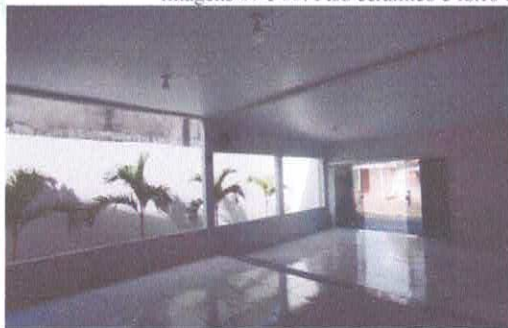
Imagem 09: Aberturas para ventilação natural