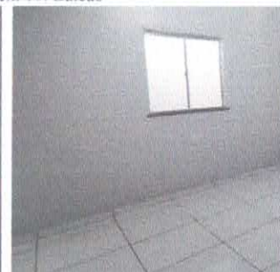
Imagem 13: Janela em vidro