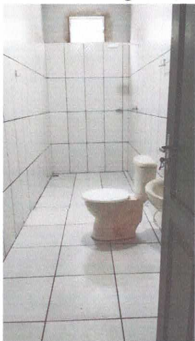
Imagem 04: BHO