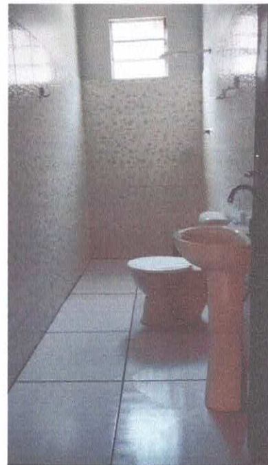
Imagem 06: BHO