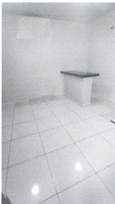
Imagem 05: Forro e Cerâmica