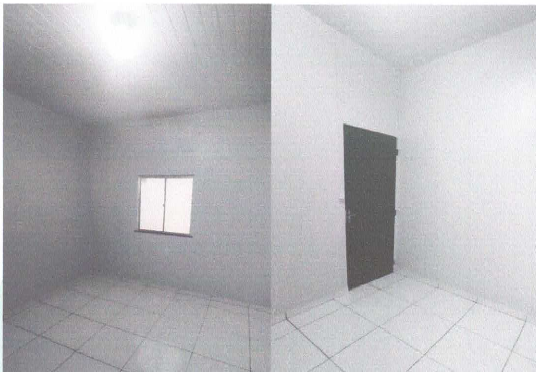
Imagens 07 e 08: Piso cerâmico e forro em PVC