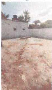
Imagem 11: Terreno