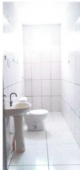
Imagens 01, 02 e 03: Piso com revestimento cerâmico