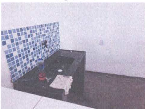
Imagem 04: Área multiuso