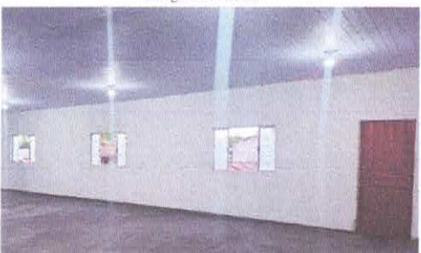
Imagem 07: Salão