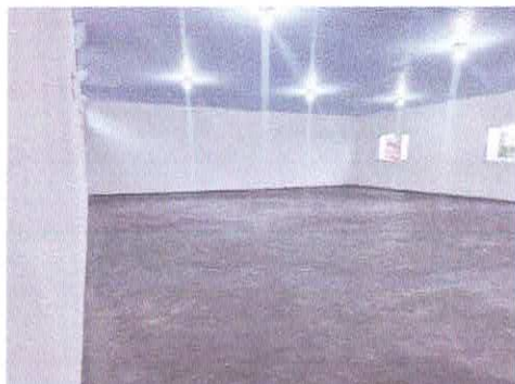
Imagem 01: Salão