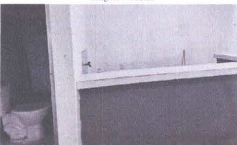
Imagem 08: Entrada do BHO

CARLOS AUGUSTO PINTO / Assinado de forma digital por CORREA:00433788208 / CARLOS AUGUSTO PINTO CORREA:00433788208