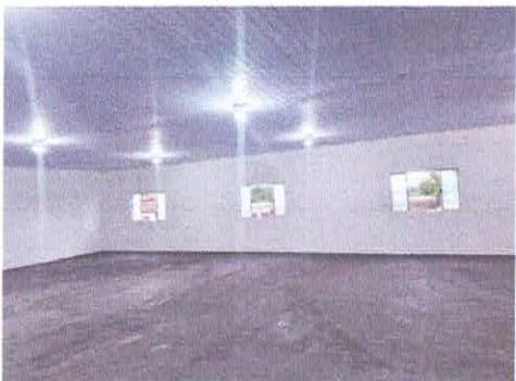
Imagem 05: Salão