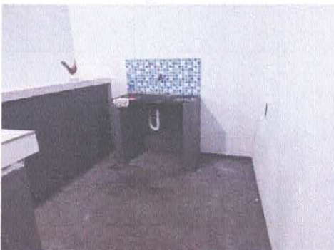
Imagem 06: Salão