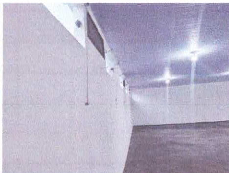
Imagem 02: Salão