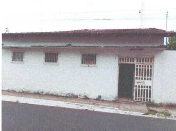
Imagem 01: Fachada