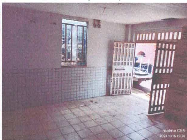
Imagem 04: Revestimento cerâmico