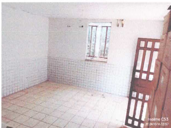
Imagem 03: Depósito