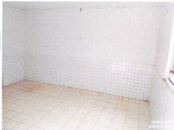
Imagem 02: Depósito