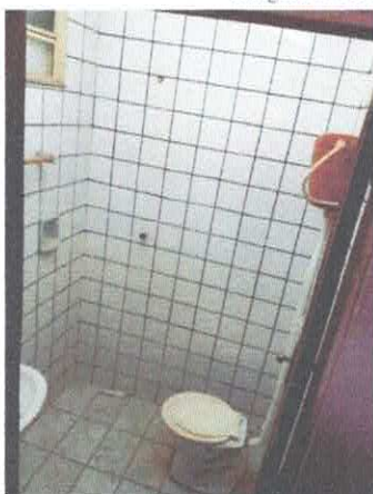
Imagem 05: BHO