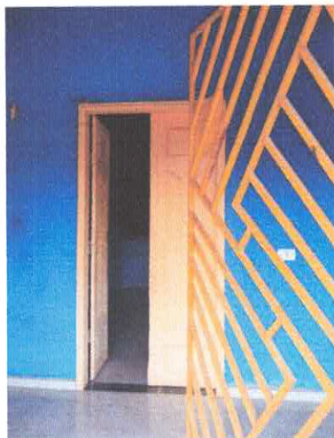
Imagem 08: Grade