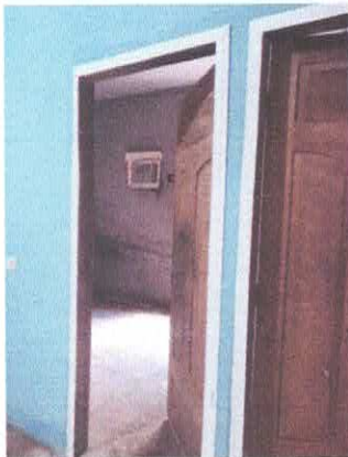
Imagem 04: Portas em madeira