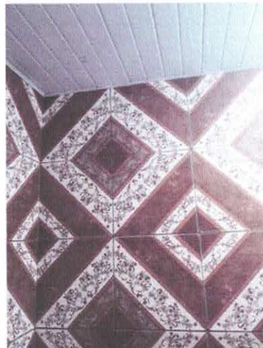
Imagem 09: Revestimento WC