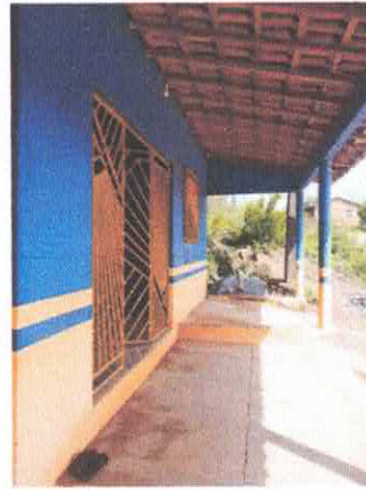
Imagem 02: Piso externo