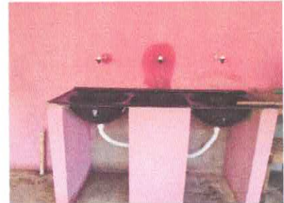
Imagem 10: Uso diverso