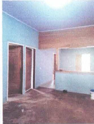
Imagem 06: Vista interna