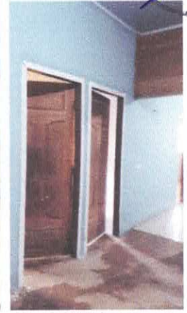
Imagem 03: Piso s/ revest.