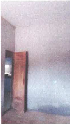
Imagem 05: Quarto