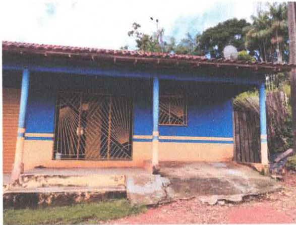
Imagem 01: Fachada