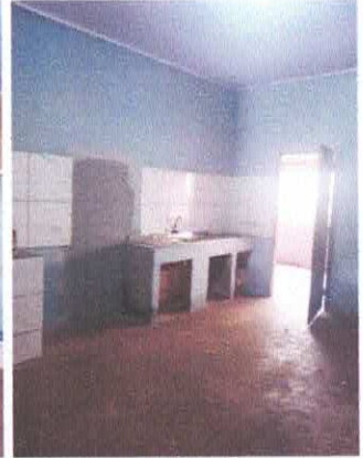
Imagem 07: Cozinha