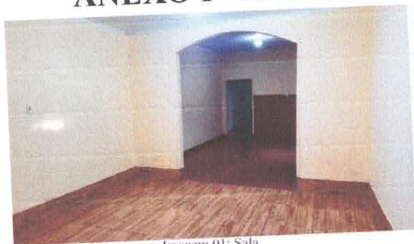
Imagem 01: Sala