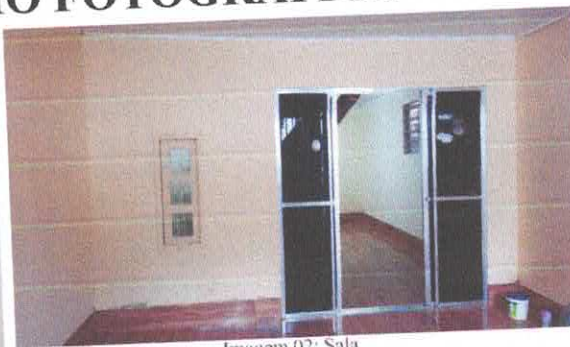
Imagem 02: Sala