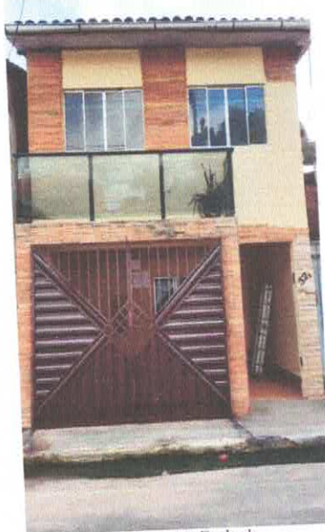
Imagem 06: Fachada