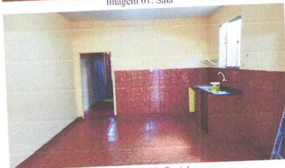
Imagem 03: Cozinha