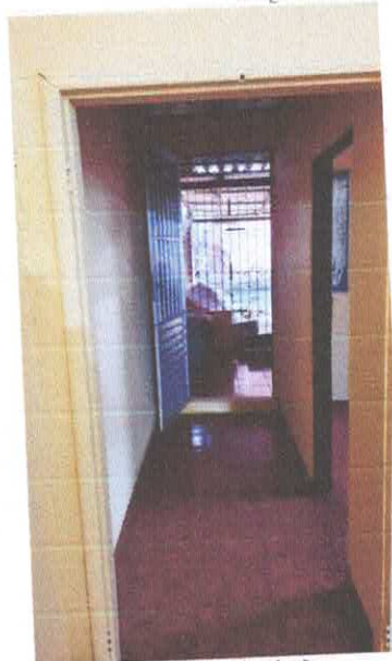
Imagem 05: Circulação