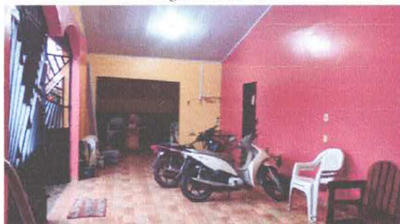
Imagem 03: Hall de entrada