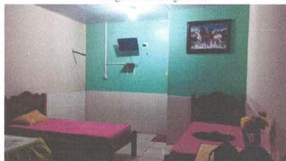
Imagem 06: Suite