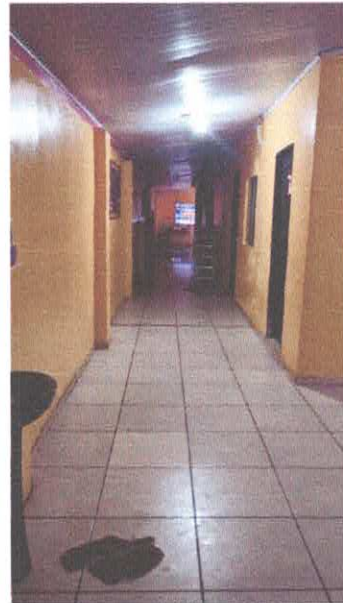
Imagem 12: Piso cerâmico