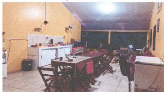
Imagem 04: Area gourmet