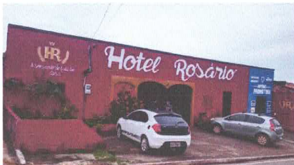
Imagem 01: Fachada