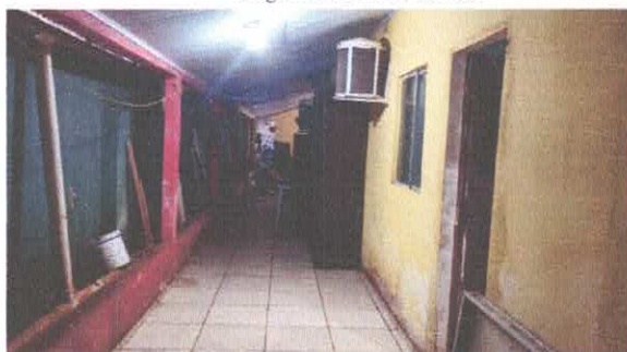
Imagem 05: Corredor