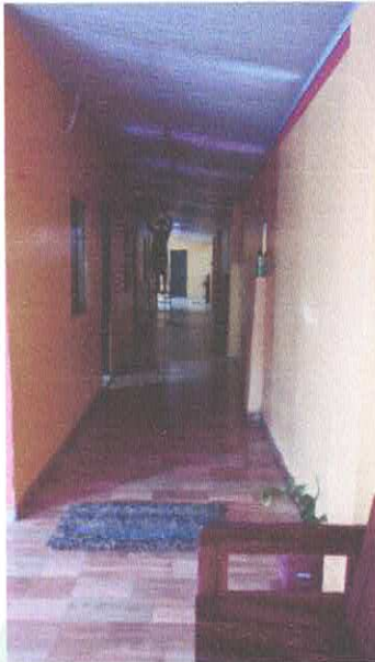
Imagem 08: Corredor