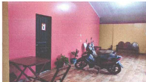
Imagem 02: Hall de entrada