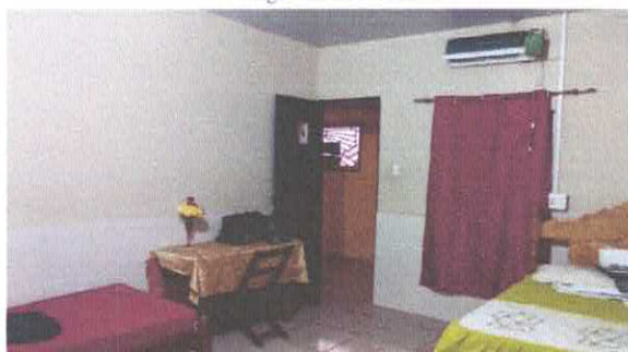
Imagem 07: Suite

Assinado de forma digital por CARLOS AUGUSTO PINTO CORREA:00 433788208 CORREA:004 33788208