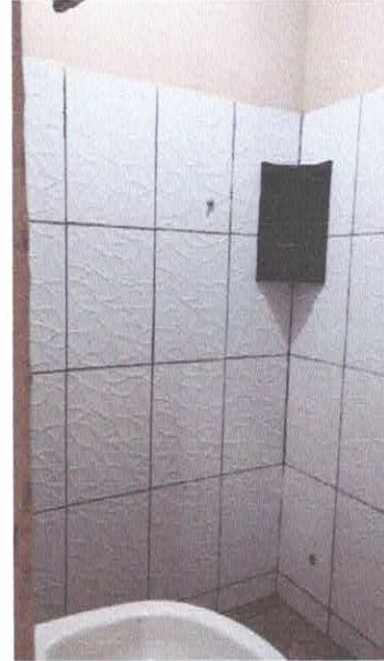
Imagem 10: Revestimento