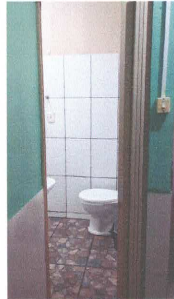
Imagem 13: Banheiro

CARLOS AUGUSTO PINTO CORREA:004337 88208