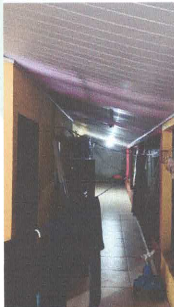
Imagem 11: Corredor