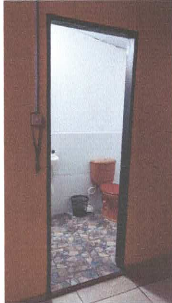
Imagem 09: Banheiro