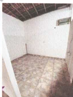
Imagem 08: Telhas