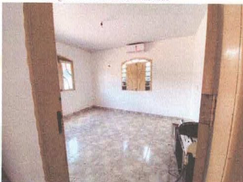
Imagem 03: Forro