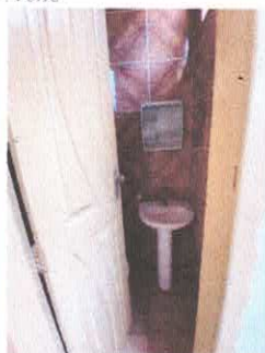
Imagem 06: Banheiro