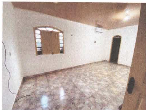
Imagem 02: Ambiente com piso cerâmico