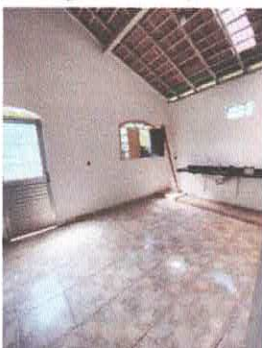
Imagem 09: Copa

CARLOS AUGUSTO PINTO CORREA:004 33788208