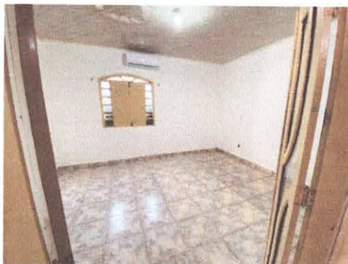
Imagem 01: Ambiente climatizado