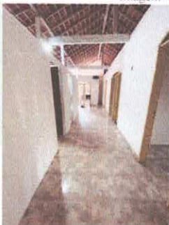
Imagem 05: Circulação